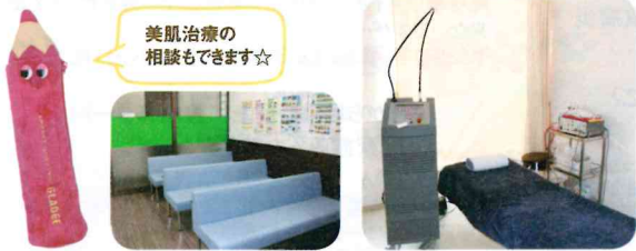
美肌治療の相談もできます☆

先生の得意分野 皮膚科一般、小児皮膚科 診療について心がけていること 患者さんの生活サイクルを聞いて、ひとつひとつ丁寧に治療を行います。