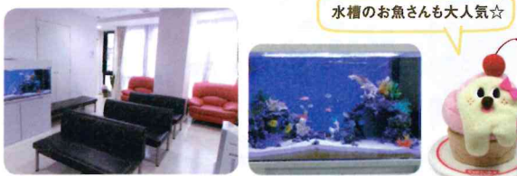
水槽のお魚さんも大人気☆

先生の得意分野 小児皮膚科、乳児アトピー性皮膚炎 診療について心がけていること 正確に診断、治療をすること。お母さんが安心して帰宅できるようにすること。